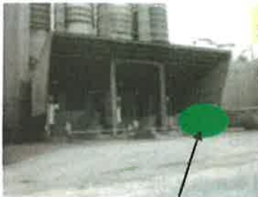
Aire de déchargement