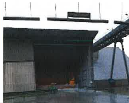
Zones de ballage Gypse et calcaire

Pour toute(s) question(s) contacter la salle de contrôle 05.46.04.34.40